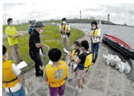
2.たぬき島ゴミ回収