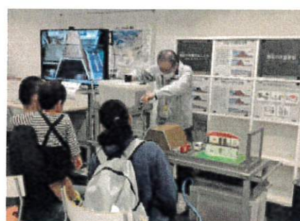
4.模型を使つての破堤見学