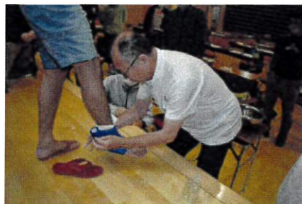
2.ファーストエイド