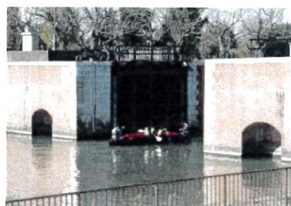
6.横利根閘門通船体験