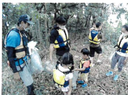
1.たぬき島ゴミ確認