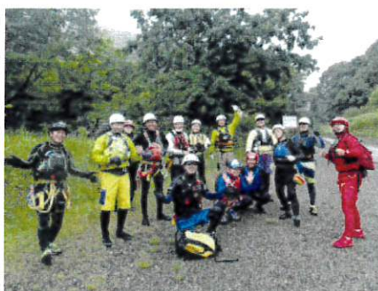
3.実習前の記念写真