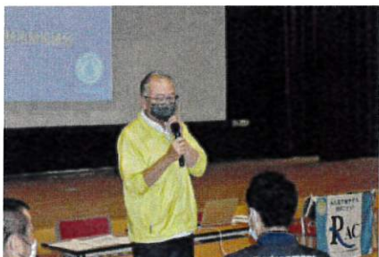
1.人材育成部会長の挨拶