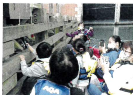
5.横利根閘門通船体験